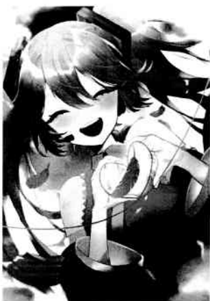
Art by nio © CFM piapro