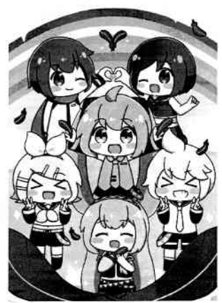
Art by ねこみん © CFM piapro