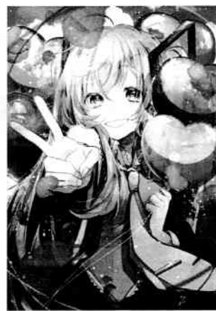
Art by あずき © CFM piapro