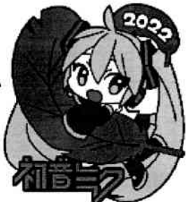
【初音ミクデザイン】