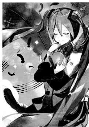
Art by yuutera10 © CFM piapro