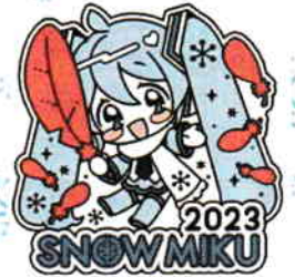
Art by せのたろう © CFM