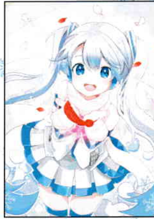
Art by なるしま © CFM

今年度も赤い羽根共同募金の雪ミクコラボグッズが発表されました。社協窓口にてクリアファイルやピンバッジなど募金額に応じてプレゼントしております。数に限りがございますので、お早めにお求め願います。