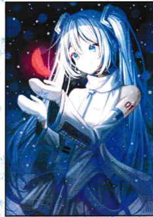
Art by くろ © CFM