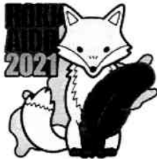
【北海道限定キタキツネ(2種)】