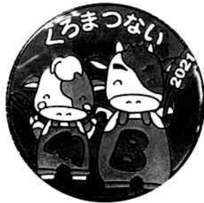
【黒松内町 ご当地デザイン】