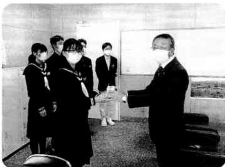
黒松内中学校生徒会からの募金受け渡しの様子