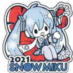
Art by ふじのきともこ ©Crypton Future Media,INC. www.piapro.net piapro