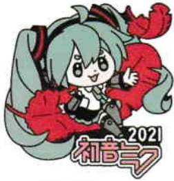
Art by またたび団子 ©Crypton Future Media,INC. www.piapro.net piapro